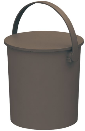
ダークブラウン [4528302 650311]