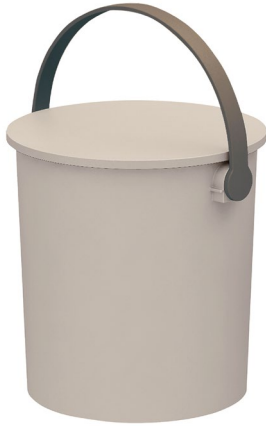
ライトブラウン [4528302 650298]